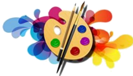
PEINTURE & DESSIN